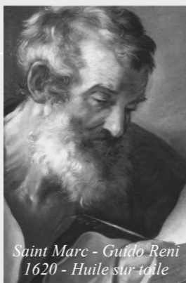
Saint Marc - Guido Reni 1620 - Huile sur toile