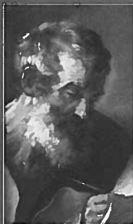
Saint Marc - Guido Reni 1620 - Huile sur toile

Jésus se retourna et, voyant ses disciples, il interpella vivement Pierre : « Passe derrière moi. Satan ! Tes pensées ne sont pas celles de Dieu, mais celles des hommes. » Appelant la foule avec ses disciples, il leur dit : « Si quelqu'un veut marcher à ma suite, qu'il renonce à lui-même, qu'il prenne sa croix et qu'il me suive. Car celui qui veut sauver sa vie la perdra ; mais celui qui perdra sa vie a