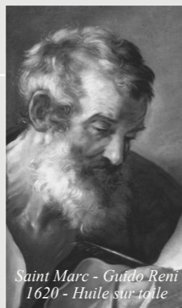
Saint Marc - Guido Reni 1620 - Huile sur toile

entre eux : « Mais alors, qui peut être sauvé ? » Jésus les regarda et dit : « Pour les hommes, c'est impossible, mais pas pour Dieu ; car tout est possible à Dieu. » Pierre se mit à dire à Jésus : « Voici que nous avons tout quitté pour te suivre. » Jésus déclara : « Amen, je vous le dis : nul n'aura quitté, à cause de moi et de l'Évangile, une maison, des frères, des sœurs, une mère, un père, des enfants ou une terre sans qu'il reçoive, en ce temps déjà, le centuple : maisons, frères, sœurs, mères, enfants et terres, avec des persécutions, et, dans le monde à venir, la vie éternelle.