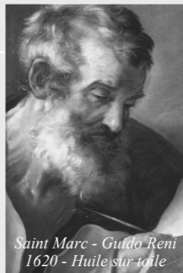
Saint Marc - Guido Reni 1620 - Huile sur toile

deviennent tendres et que sortent les feuilles, vous savez que l'été est proche. De même, vous aussi, lorsque vous verrez arriver cela, sachez que le Fils de l'homme est proche, à votre porte. Amen, je vous le dis : cette génération ne passera pas avant que tout cela n'arrive. Le ciel et la terre passeront, mes paroles ne passeront pas. Quant à ce jour et à cette heure-là, nul ne les connaît, pas même les anges dans le ciel, pas même le Fils, mais seulement le Père.