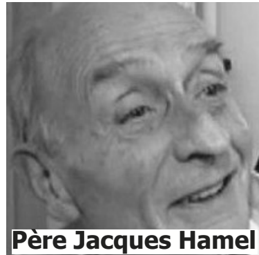
Père Jacques Hamel

L'aide au développement, le secours des migrants, l'appui aux États du Moyen Orient qui redonne espoir aux chrétiens de pouvoir rester chez eux,